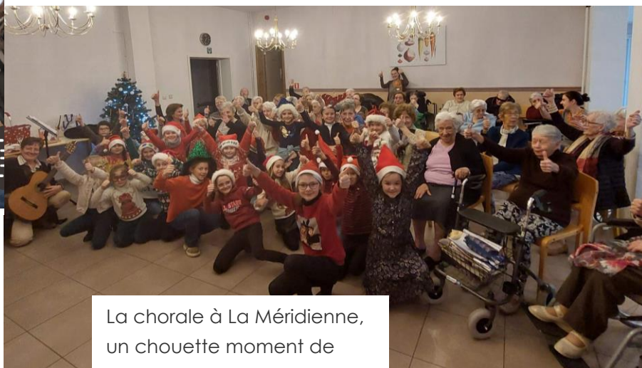
La chorale à La Méridienne, un chouette moment de partage intergénérationnel