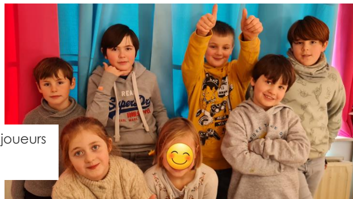
Groupe des joueurs d'échecs

Les réalisations des embarcations pour la célébration de Noël... un autre moment de partage.